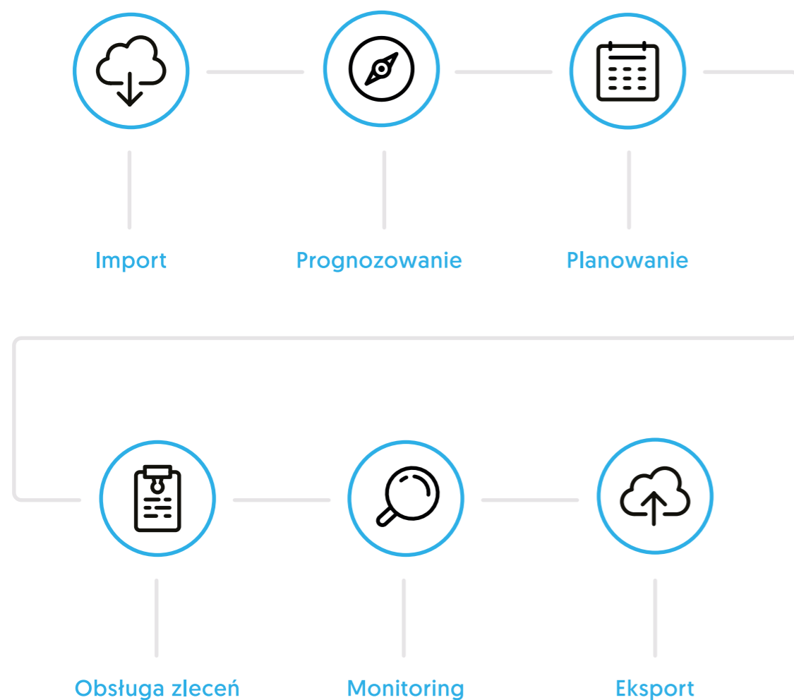
Proces zarządzania gotówką wspierany przez Asseco ACM.

Asseco ACM wspiera proces zarządzania gotówką na każdym jego etapie od zebrania wymaganych danych poprzez prognozę, planowanie, przeliczenie gotówki i obsługę zleceń aż do rozliczenia operacji.